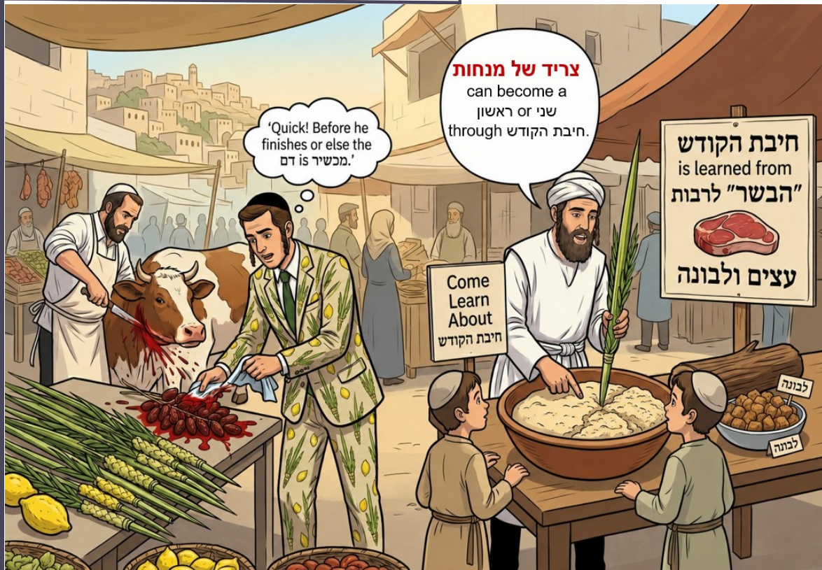
The lulav salesman trying to wipe off דם שחיטה that splattered on the dates of his lulavim before the shechitah was finished, so the דם isn't מכשיר the dates, had just sold a lulav to a Kohen who used it for a חיבת הקודש demonstration with a dry part of a minchah that became a שני או ראשון and taught חיבת הקודש is learned from "והבשר" which comes to include לבונה. עצים ולבונה that become tamei like food, even though they're inedible.